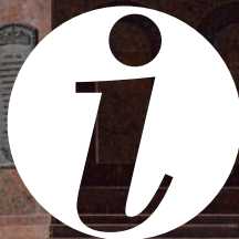
Текст: Лидия Дашкова, Руслан Емельянов Дизайн и верстка: Настя Афанасьева

туристский информационный центр Алтайского края